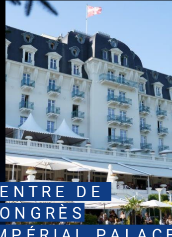
CENTRE DE CONGRÈS IMPÉRIAL PALACE