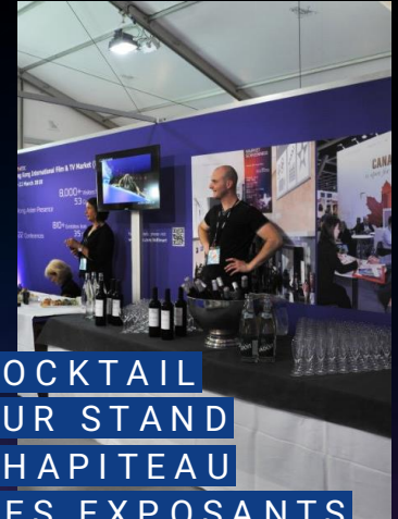
COCKTAIL SUR STAND CHAPITEAU DES EXPOSANTS