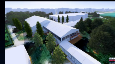
Chapiteau des Exposants Espace Détente