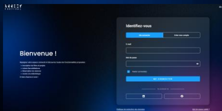
Liste des participants et sociétés Vidéotheque Billetterie et invitations