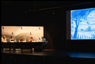
WIP Leçons de cinéma Making Of