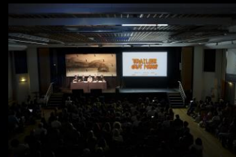
Evènements Mifa incluant Contenu Industrie Contenu Talents Contenu XR & GAMES