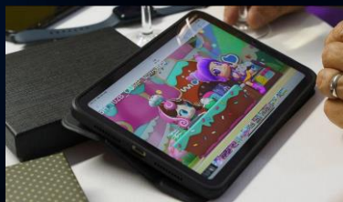
2 inscriptions à la vidéotheque